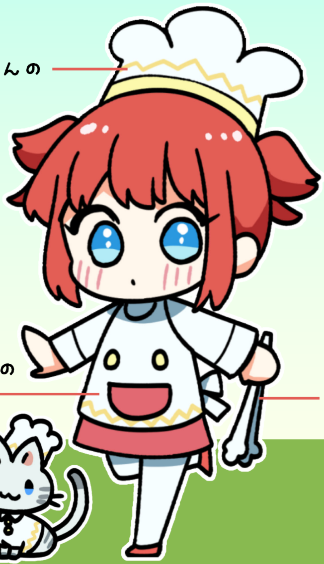
パンやさんの ぼうし

わたしはパンやさん。ねこてんちょうといっしょにベーカリーアイランドにすんでいるよ。おいしいパンをやくことがとくいなんだ。みんなもたべにきてね！